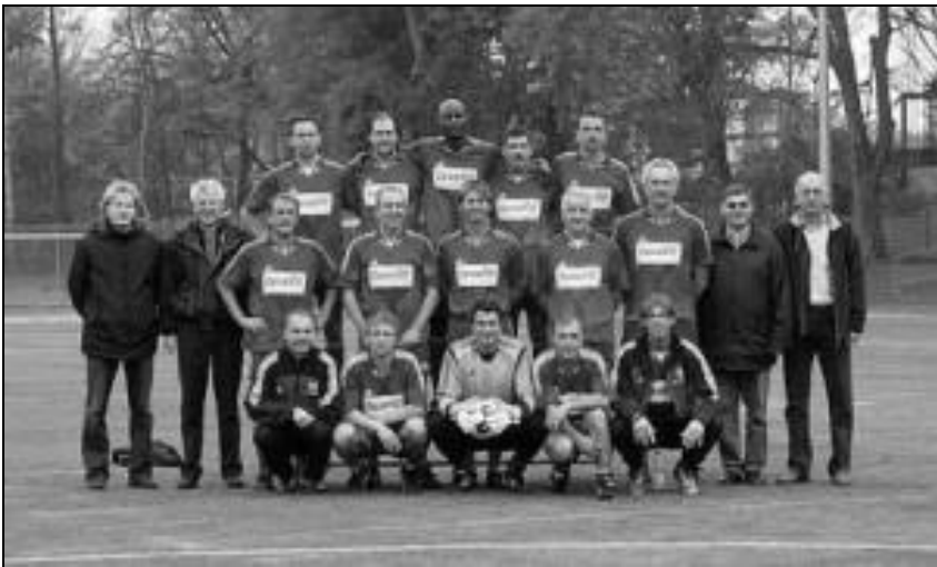
Die Traditionsmannschaft des 1. FC Köln