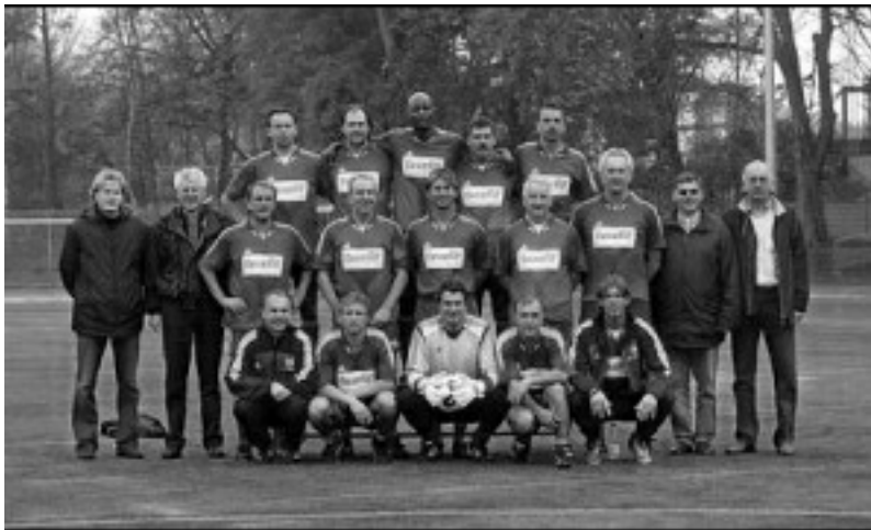
Traditionsmannschaft des 1.FC Köln